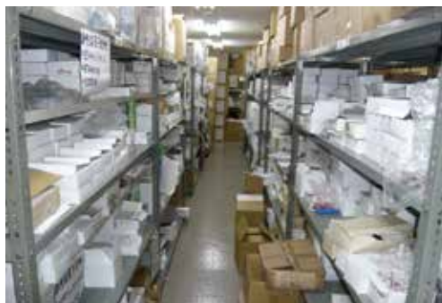
(株)タキザワ 本社倉庫