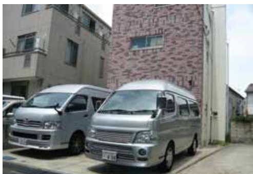
(株)タキザワ 松島倉庫