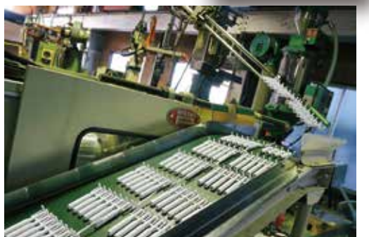
三郷工場 全自動成型機