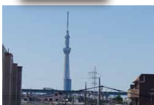
松島倉庫屋上からのスカイツリー