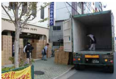
中国工場からの部材到着